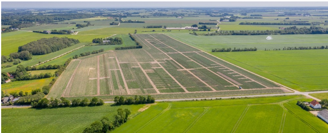
Dronebillede af forsøgsmarken

Herudover bliver der mulighed for at snakke om de nyeste stivlessorter og deres fordele og ulemper.