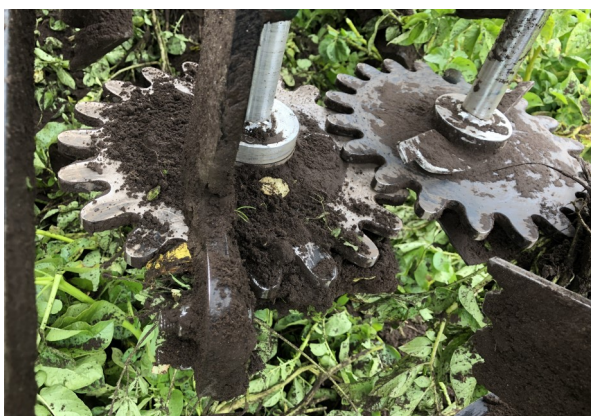
Crown Crusher— mekanisk vækststandsning

På AKV har vi den opfattelse, at vi skal arbejde aktivt på løsninger, der reducerer pesticidforbruget. Der er en målsætning fra politisk og befolkningsside om, at der skal ske en reduktion, og er vi på forkant med at finde løsninger, vil det forhåbentlig også være de bedste løsninger.