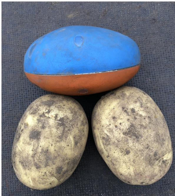
Den elektroniske kartoffel

Af agrokonsulent Niels Jørgen Kristensen